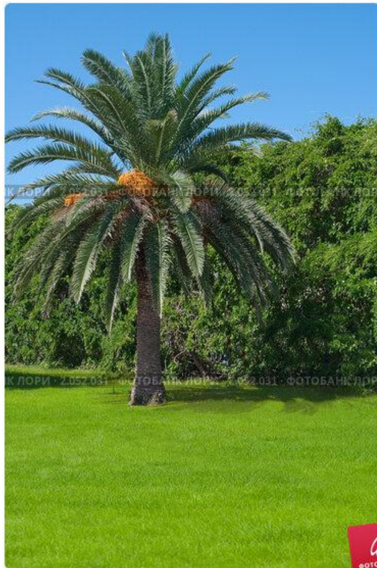
Финиковая пальма на черноморском побережье. Абхазия. Пицунда.