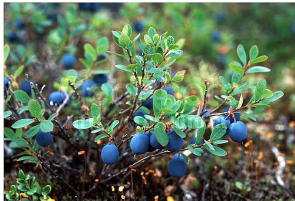
# kdr00059 Russia, Kola Peninsula, Khibines mountains, autumn views