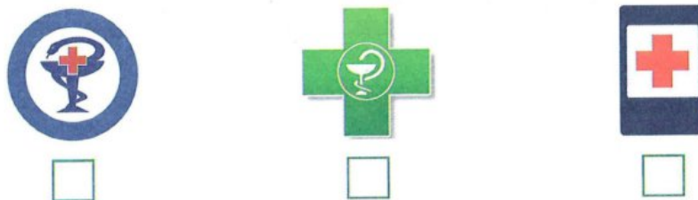
Рис. 10. Презентация «Знак аптеки»

Внимательно рассмотри изображения. Как ты думаешь, какое изображение может быть размещено на здании аптеки?