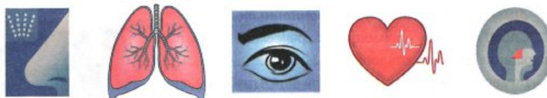
Рис. 12 Презентация «Рисунки на лекарствах»

Рассмотри изображения. Как ты думаешь, на упаковках каких лекарств они могут быть размещены?