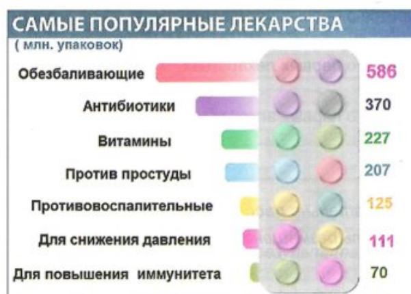
Рис. 13 Презентация «Самые популярные лекарства»

Рассмотри диаграмму и ответь на вопросы.